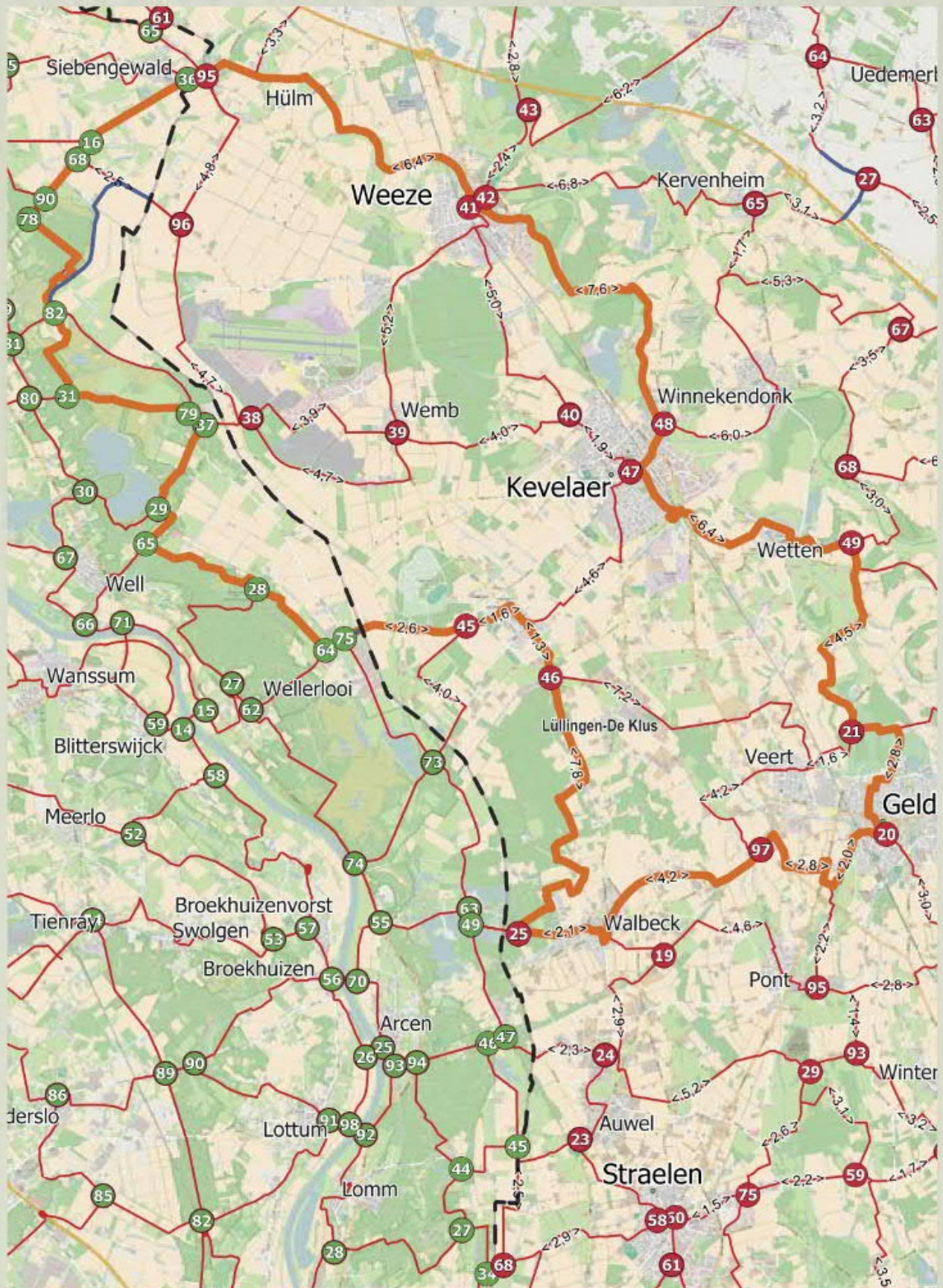
Große Spargelroute 78,5 km