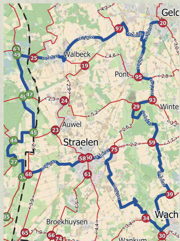
Mittlere Spargelroute 51,3 km